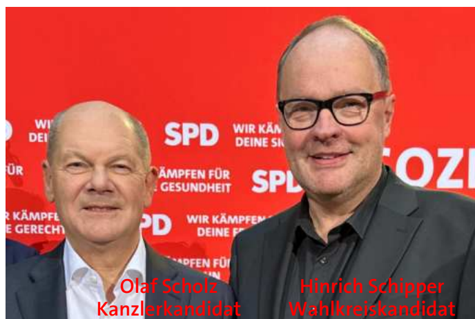
Olaf Scholz Kanzlerkandidat